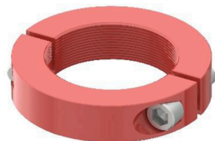
Nuovo sistema bloccaggio martinetti New stabilizers locking system